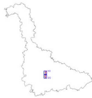
Plan de situation