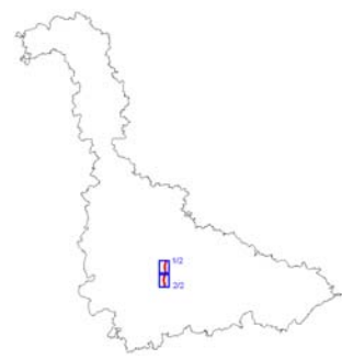
Plan de situation